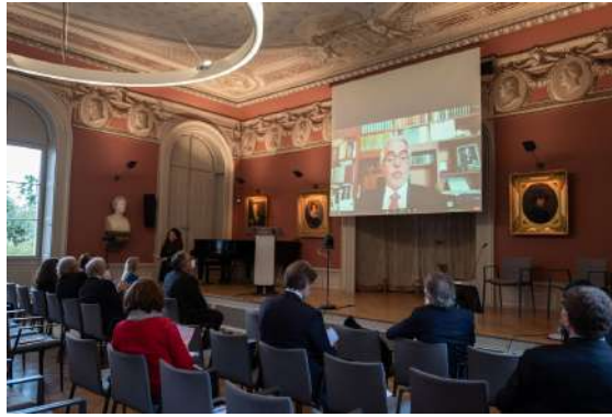
Diego García-Sayán, Relatore speciale sull'indipendenza di giudici e avvocati (a distanza)