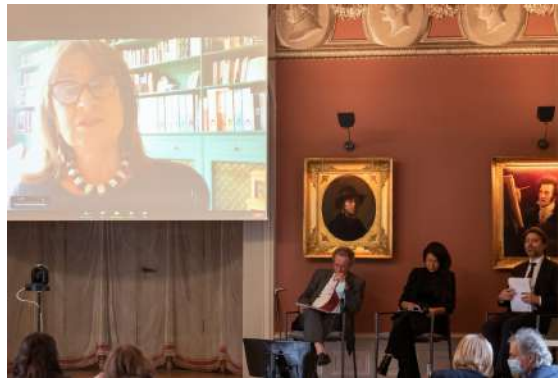
Baronessa Helena Kennedy QC, Direttore dell'IBA Human Rights Institute (a distanza)